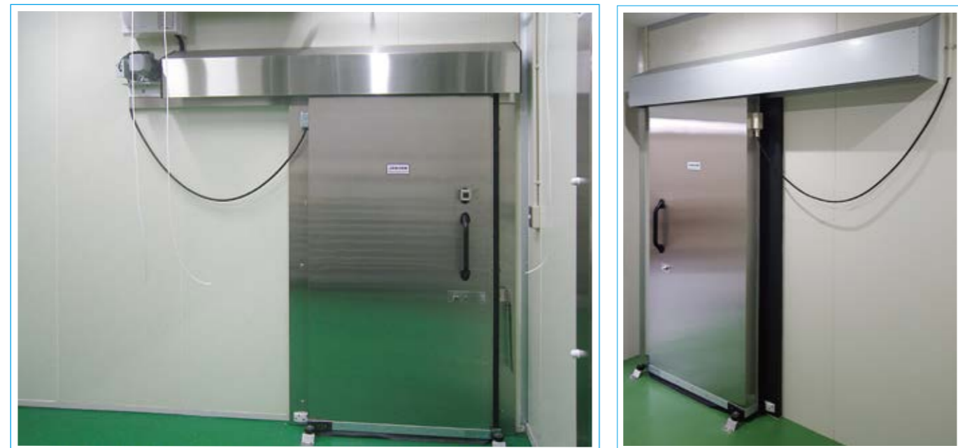
電動片引 (オプション:チェーンカバー-SUS仕様)